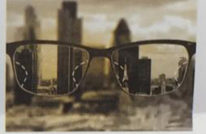
Tüm görüş alanlarında mükemmel uyum, en yüksek görme konforu