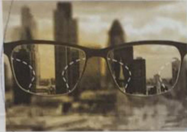
Uzak ve yakın alanlarda dinamik hareketlerde doğal görüş deneyimi