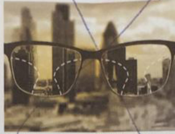
Net görüş ve mükemmel gündelik performans