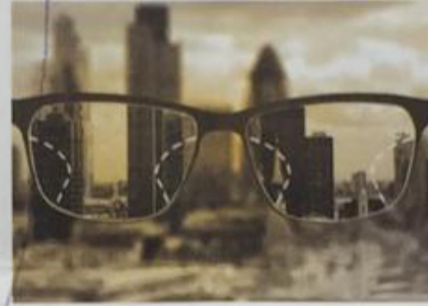
Yaşam tarzına özel tasarım