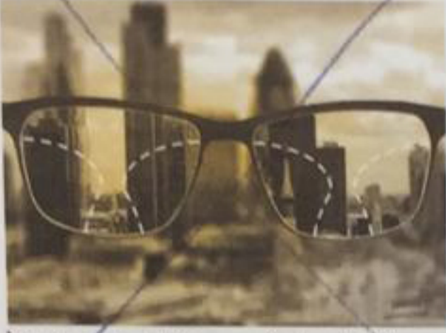
İlk kullanıcılar için her mesafede net görüş